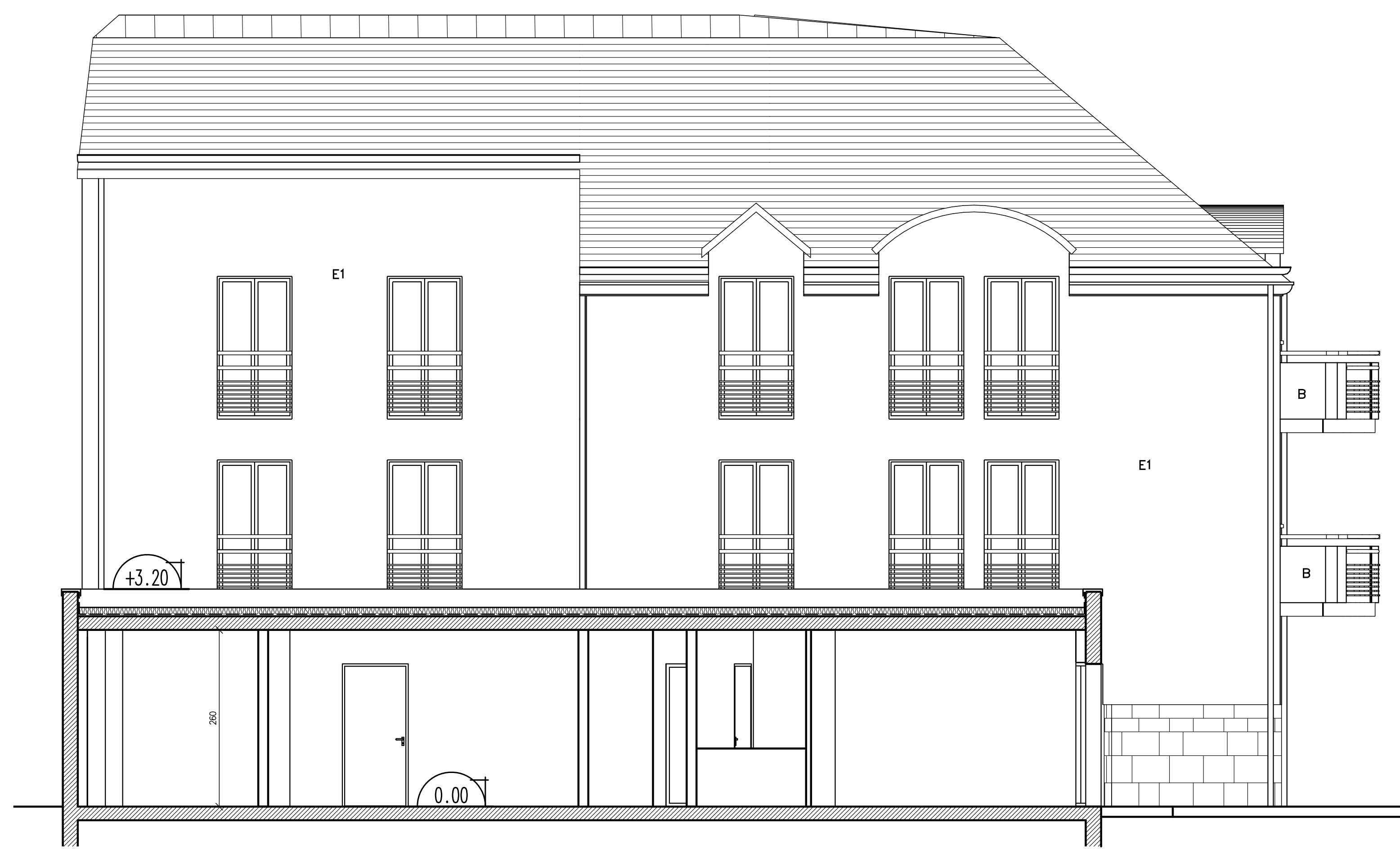
ELEVATION OUEST BATIMENT B / COUPE DD