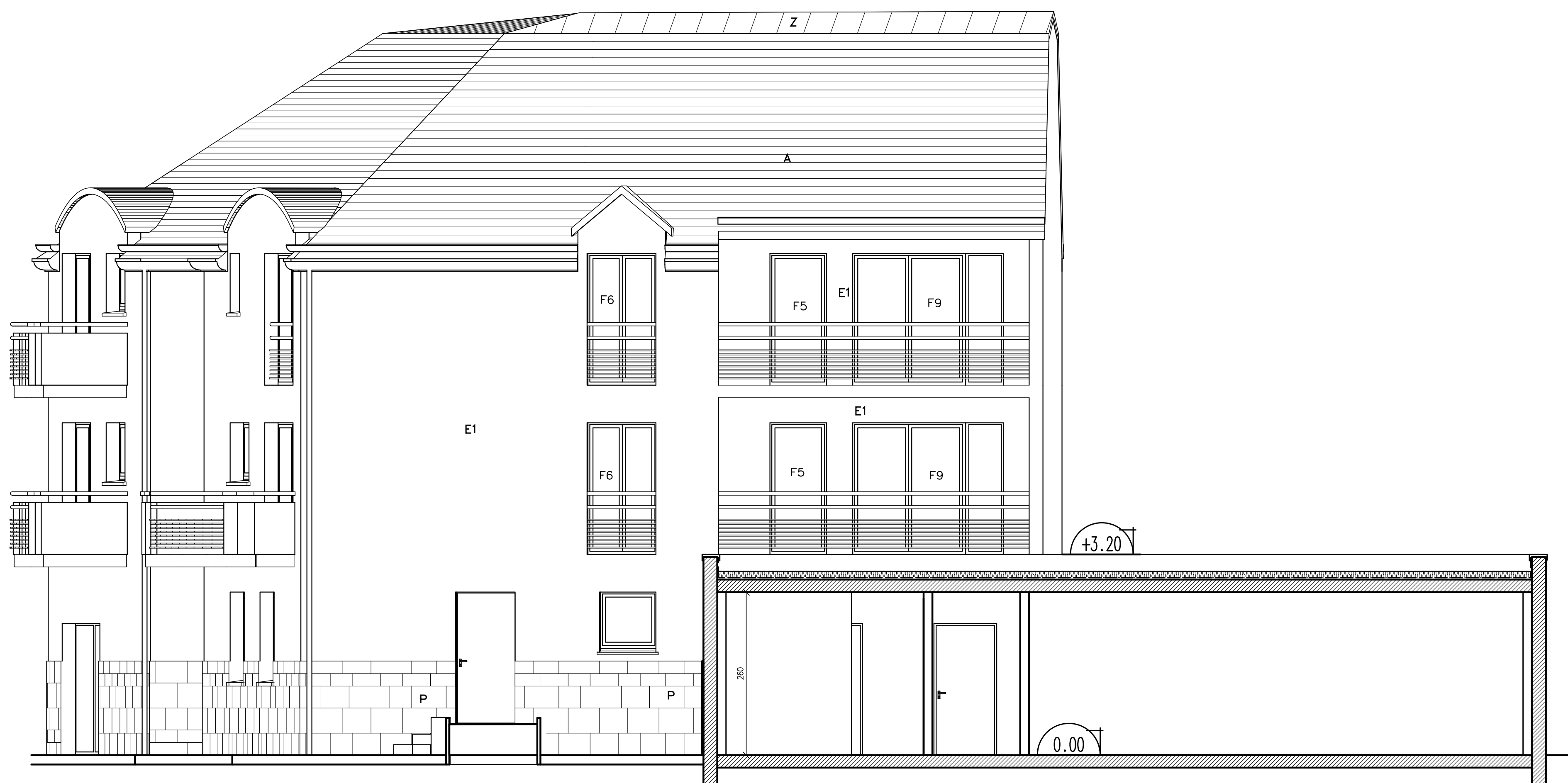
ELEVATION EST BATIMENT A / COUPE CC