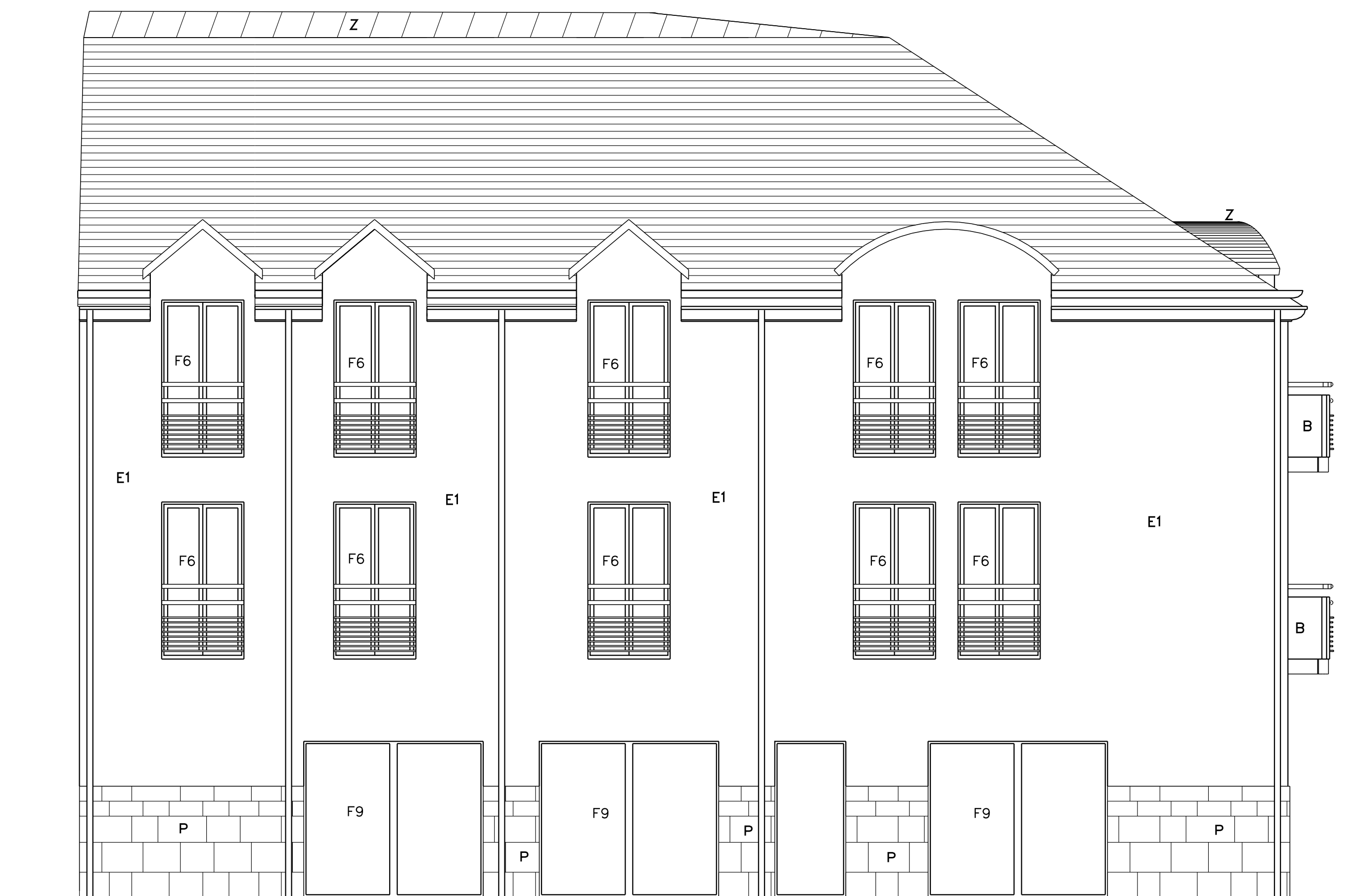
ELEVATION OUEST BATIMENT A