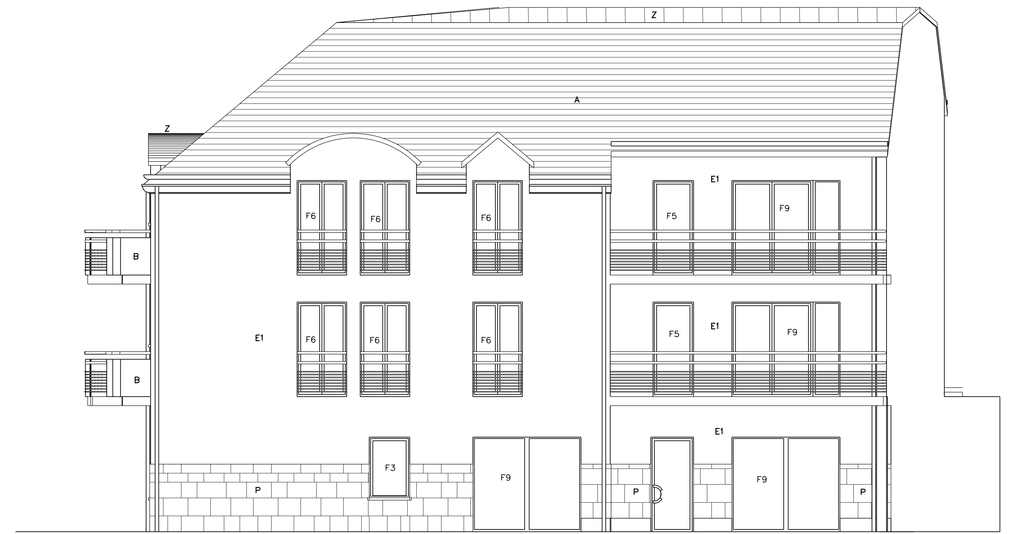
ELEVATION EST BATIMENT B